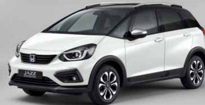
PLATINUM WHITE PEARL / BICOLOR