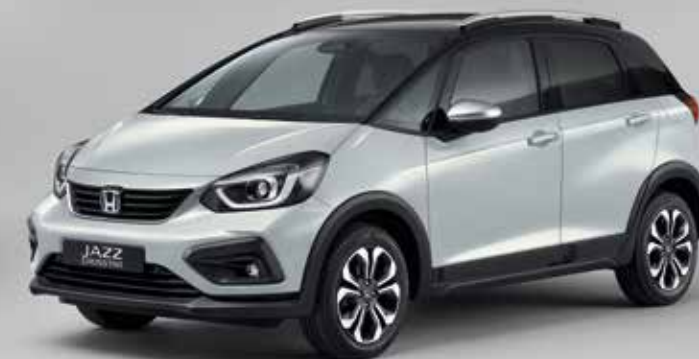
PREMIUM SUNLIGHT WHITE PEARL / BICOLOR