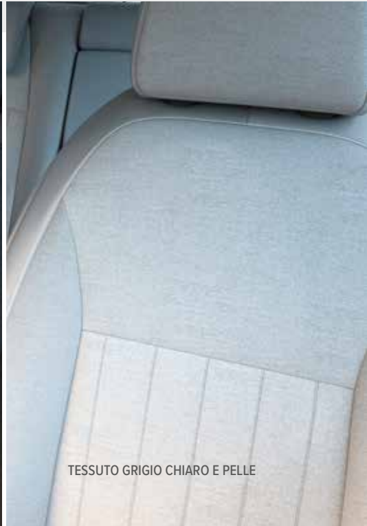
TESSUTO GRIGIO CHIARO E PELLE