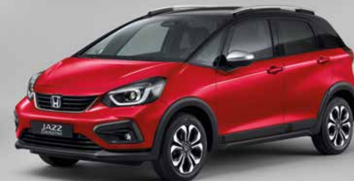
PREMIUM CRYSTAL RED METALLIC / BICOLOR