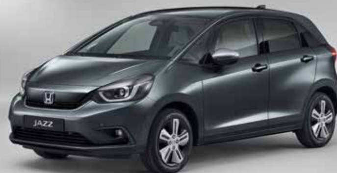
SHINING GRAY METALLIC