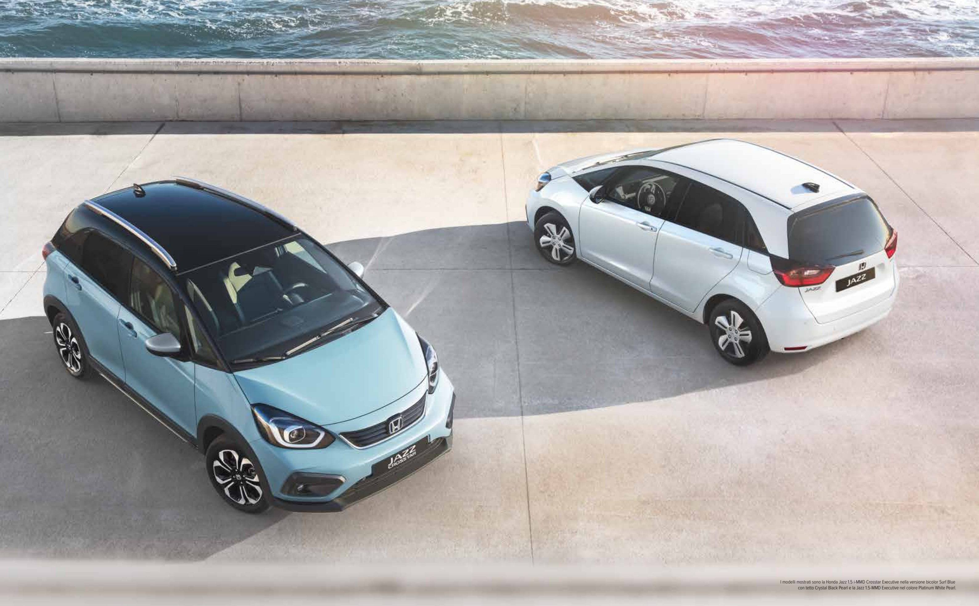
I modelli mostrati sono la Honda Jazz 1.5 i-MMD Crosstar Executive nella versione bicolor Surf Blue con tetto Crystal Black Pearl e la Jazz 1.5-MMD Executive nel colore Platinum White Pearl.