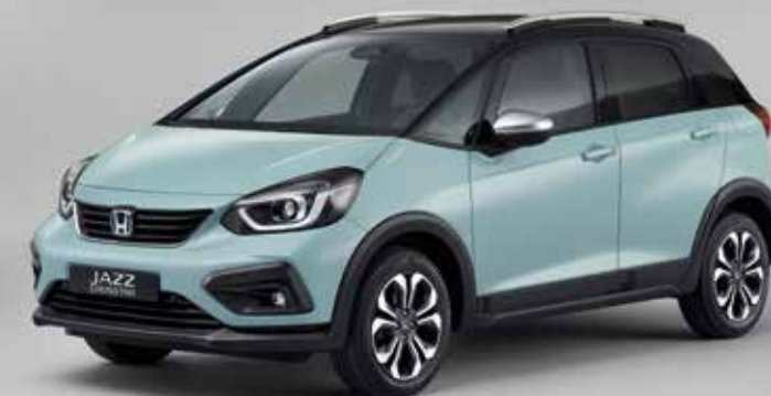
SURF BLUE / BICOLOR