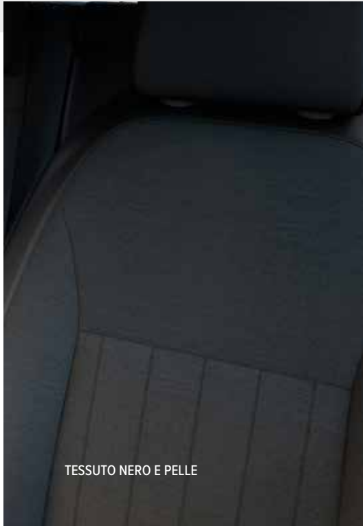
TESSUTO NERO E PELLE