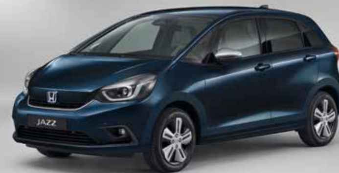
MIDNIGHT BLUE BEAM METALLIC